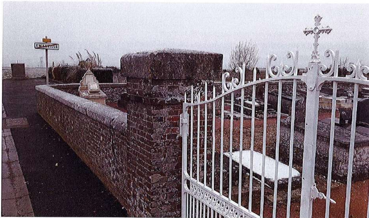
Entreprise Manière TP d'Emanville

Les allées sont désormais toutes praticables, le parking a fait peau neuve et l'accessibilité devrait venir compléter les derniers travaux.