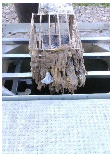
Panier de la pompe de relevage rue d'Avrilly (Collecte toutes les semaines de tout le village)

Afin de limiter les désagréments liés aux bouchages des canalisations et aux coûts associés, les lingettes et tous autres déchets solides non destinés à être jetés dans les toilettes, doivent impérativement être jetés dans la poubelle.