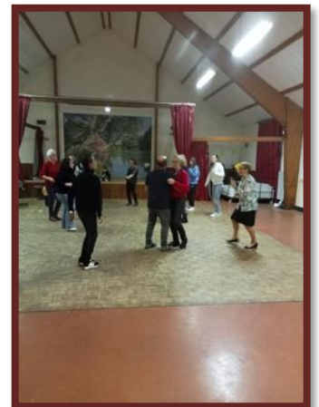
Le Comité des fêtes