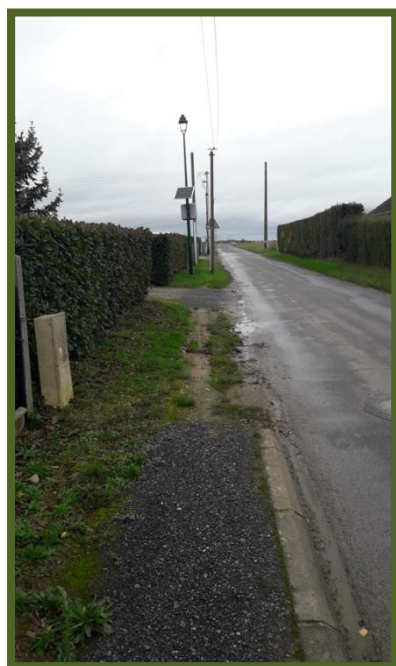
Rue Saint Léger actuel