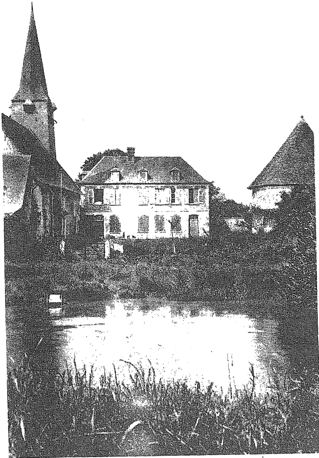
EMANVILLE (Eure). — Le Manoir de l'Église

Le fief de Couillarville est détenu successivement par les ... de Couillarville, les de Fleurigny, les de Nollent. cette dernière famille était présente à la révolution; plus tard, en 1812, un de Nollent-Couillarville est maire d'Emanville