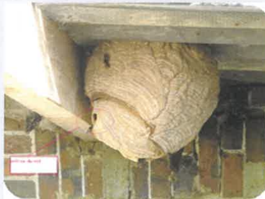
Nid secondaire Sphérique à piriforme Environ 70 cm de diamètre Petite ouverture latérale Arbres, à plus de 10 m (75 % des cas)