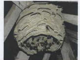
Nid de frelon européen 30 cm, large ouverture vers le bas