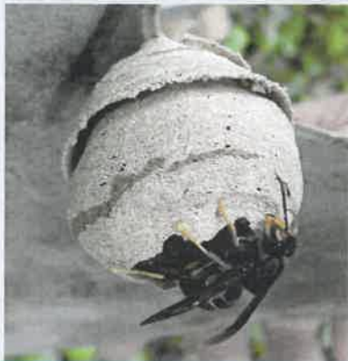
Nid primaire sphériques, 10 cm, endroit abrité

reconnaître un nid de frelon asiatique parmi d'autres nids