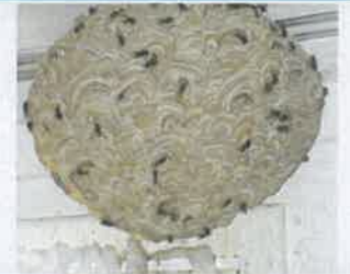
Nid de guêpe 30 cm, petite ouverture vers le bas

Groupement de Défense Sanitaire de l'Eure