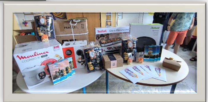
Lots de la kermesse de l'école