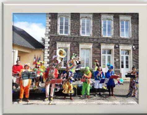
L'équipe de l'ASPAREL

L'ASPAREL recrute ! N'hésitez pas à venir renforcer notre équipe. Plus nous sommes nombreux, plus il est facile d'organiser les ventes et manifestations qui nous permettent de gagner de l'argent pour les enfants des trois écoles ! Notre assemblée générale de rentrée aura lieu en septembre. N'hésitez pas à vous renseigner dès le début de l'année scolaire dans l'école de votre enfant.